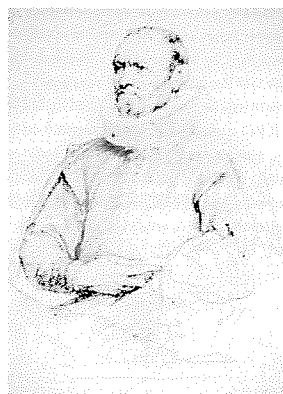
Rockox (A. Van Dijck)