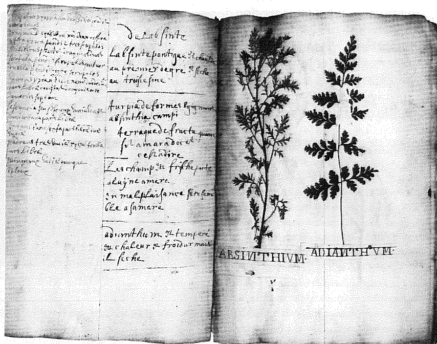
Herbarium in de Pharmacopœia Lillensis met Absint(alsen) en Adiantum (of Venushaar, een varensort).