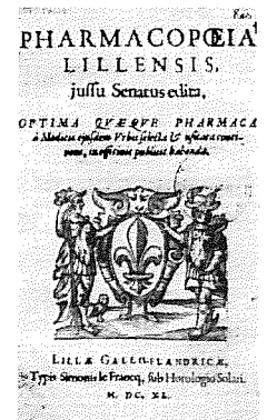
De gedrukte uitgave van de Pharmacopœia Lillensis [...] Lille, Typis Simonis le Francq 1640.