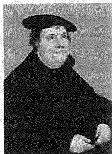
Maarten Luther, 1543