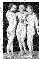
De drie gratiën, 1530