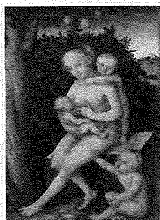
Caritas - in het Koninklijk Museum voor Schone Kunsten (Antwerpen)