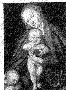
Madonna met kind, ca. 1545