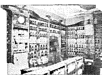
Bon Secours - Anspachlaan

BRUSSEL, ANSPACHLAAN BRUSSEL, BOULEVARD ANSPACH Anspach