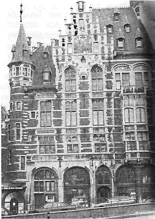
Delacre - Coudenberg