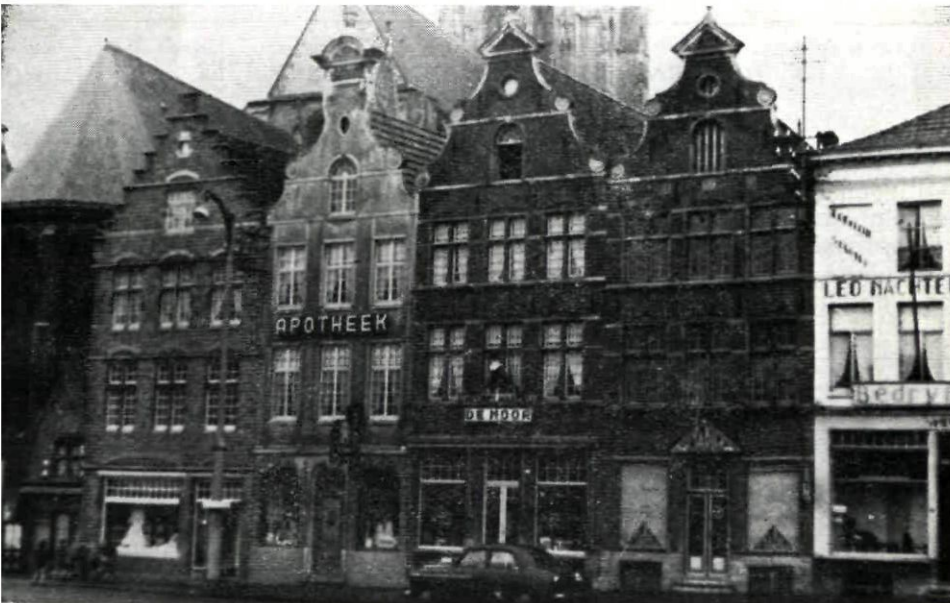
Fig. 2. — Huidige toestand. In het midden het vroegere « Moriaenshoofd » nu « Meubelmakerij De Moor » met de naar buiten leunende neger.